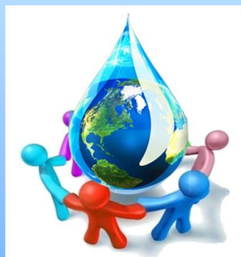
ГРАФИК И РАБОТНА ПРОГРАМА И МЕРКИ ЗА КОНСУЛТАЦИЯ С ОБЩЕСТВЕННОСТТА ЗА ПУРЪ И ПУРН