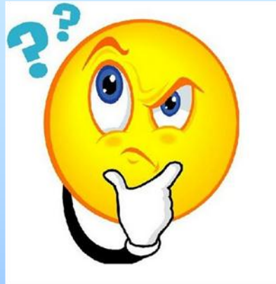
ГРАФИК И РАБОТНА ПРОГРАМА И МЕРКИ ЗА КОНСУЛТАЦИЯ С ОБЩЕСТВЕННОСТТА ЗА ПУРБ И ПУРН

Срок за консултацията: 22.12.2012г - 22.06.2013г